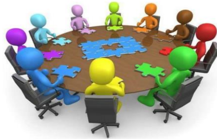
Stratejik Plan Hazırlama Ekibi

Günümüzün bu hızlı deęişimleri ile başa çıkabilmek için, geliştirilen yeni yönetim şekillerini her yöneticinin bilmesi gerekir. Kurumlar deęişimle başa çıkabilmek için, deęişimi yönetmeyi öğrenmelidirler. Çevredeki deęişimlere paralel olarak kurumdaki deęişimleri gerçekleştirmede en büyük yükü yönetim taşımaktadır. Bütün bu bilgilerin ışığında günümüz dünyasında stratejik planlamanın olmazsa olmaz bir gereklilik olduğunu söyleyebiliriz. Gelişen ve deęişen dünyaya uyum sağlayan, geleceęi planlayan kurumların ayakta kalacağı gerçeğinden hareketle bu plan, Planlama Ekibi tarafından bütün paydaşların katılımıyla meydana getirilmiştir.